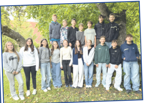
Unsere Konfirmande aus Seißen und Suppingen