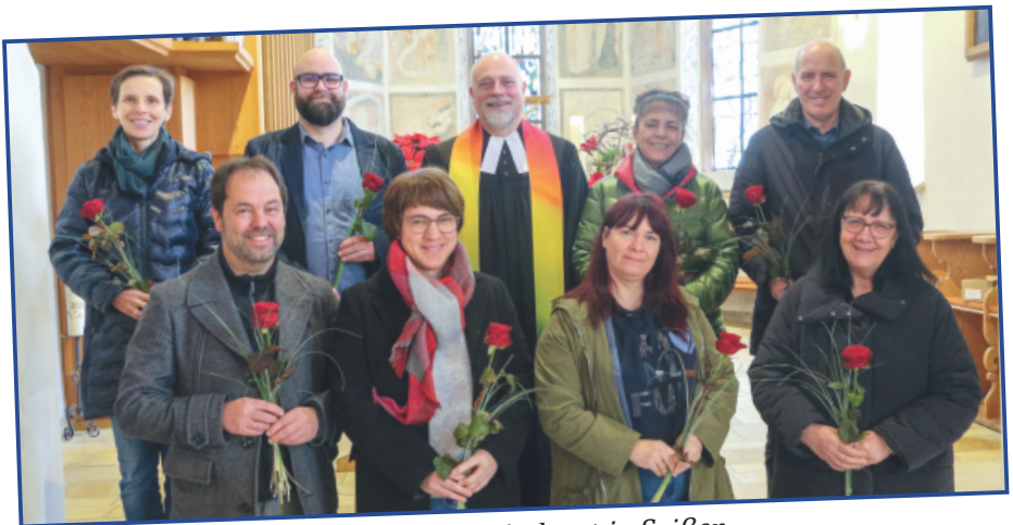
neuer Kirchengemeinderat in Seißen