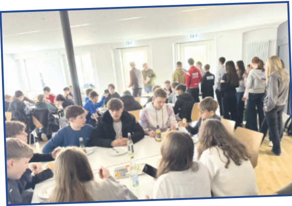
Konfi-Aktions-Tag in Merklingen