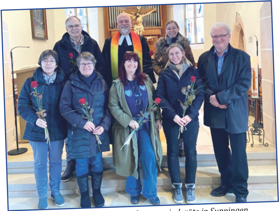
neue und verabschiedete Kirchengemeinderäte in Suppingen