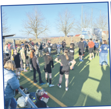
Konficup in Ehingen