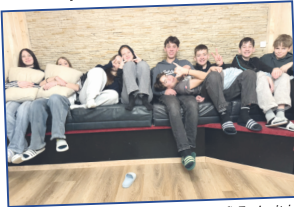
Konfi-Freizeit in Blaichach