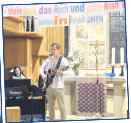
Buß- und Betttag Gottesdienst