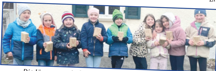
Die Jüngeren mit ihren Ostergeschenken