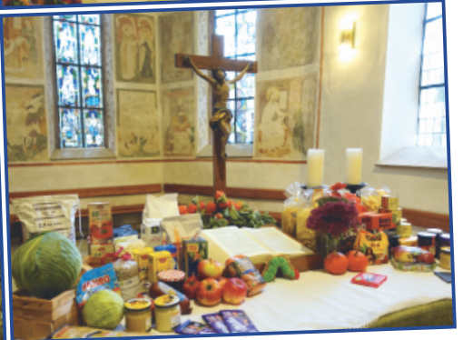
Erntedank-Gottesdienst mit Anspiel des Kindergartens über „die Raupe Nimmersatt“ und Mitwirkung des Musikvereins