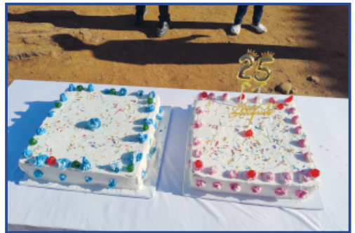
Die Festkuchen warten darauf, angeschnitten und verteilt zu werden.

gestemmt. Einkäuferin Pauline Wanjiku verwandelte ihren kleinen Lageraum sogar in eine Backstube für die Festkuchen. Diese gehören – mit buntem Zuckerguss verziert – zum obligatorischen Bestandteil einer kenianischen Feier.