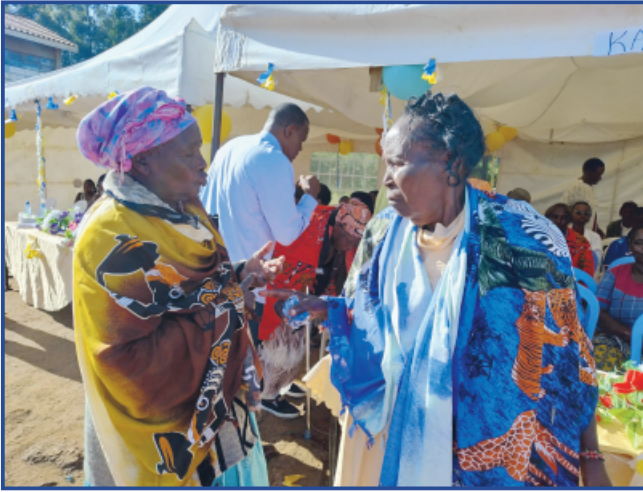
Ehregäste aus dem Dorf

wuchs eine Freundschaft wie mächtige Bäume. Von Karais Heimat bis zu Deutschlands Land, ein starker Bund, Hand in Hand.“ (Übersetzung aus dem Englischen).